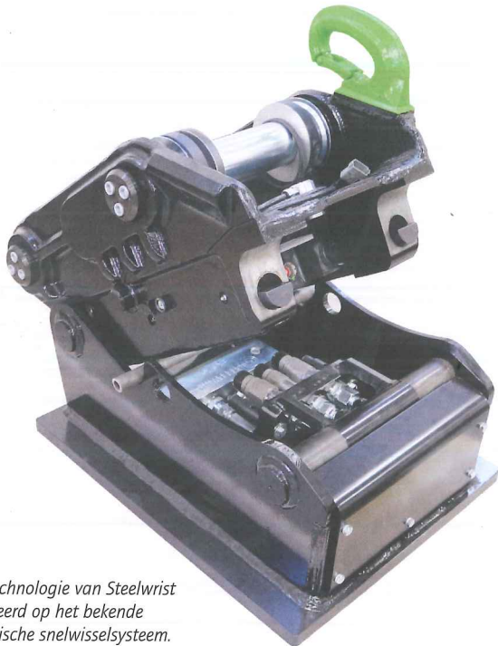
De SQ-technologie van Steelwrist is gebaseerd op het bekende symmetrische snelwisselsysteem.